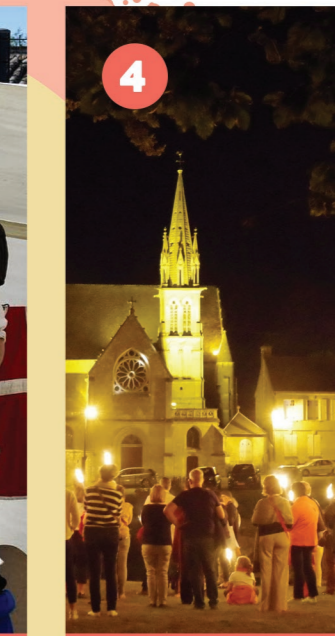
4 PLACE GAMBETTA Visite nocturne