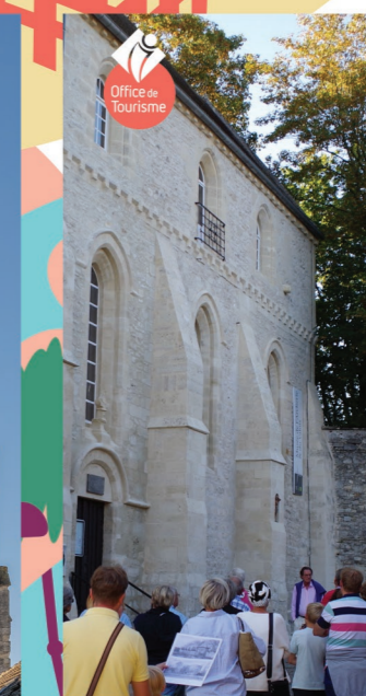
VISITE GUIDÉE Circuit commenté