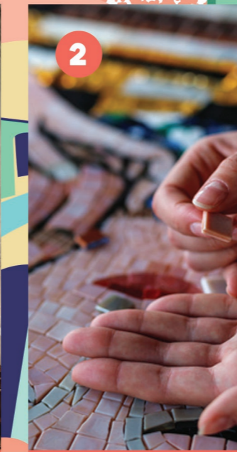
2 ABBAYE SAINT-ARNOUL Ateliers mosaïque