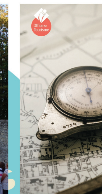
OFFICE DE TOURISME Jeu de piste