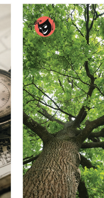
SPECTACLE Le dernier rêve du vieux chêne