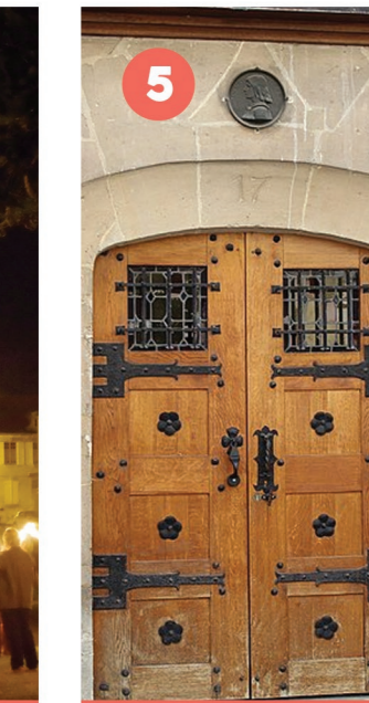
5 HÔTEL D'ORLÉANS Conférence