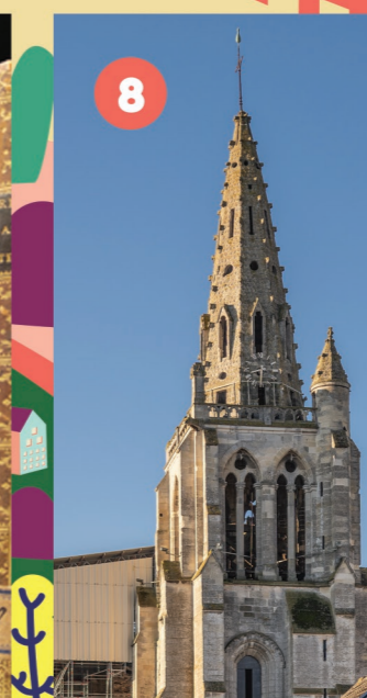
8 SAINT-THOMAS Exposition