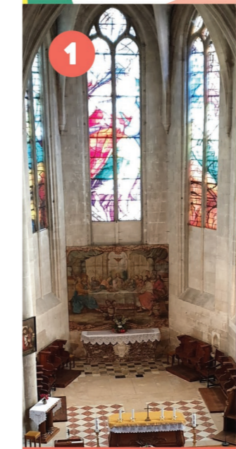
1 ÉGLISE SAINT-DENIS Visite

Remparts du Donjon de Vez – Coopérative à Mareuil sur Ourcq – Parc de l'ancien château à Lagny le Sec – Parc de Géresme à Crépy en Valois. Des expositions XXL éphémères à ne pas manquer qui dureront... le temps de la météo !