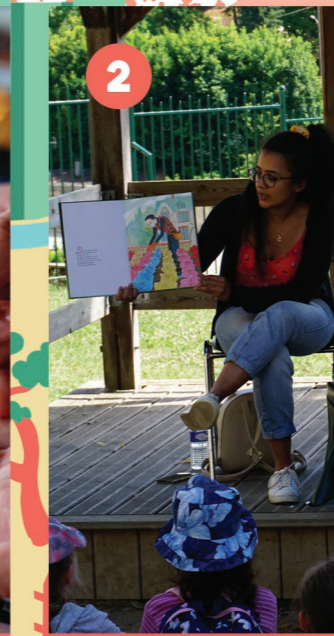
2 ABBAYE SAINT-ARNOUL Bébés lecteurs