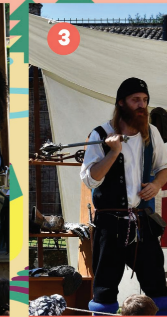
3 MUSÉE DE L'ARCHERIE Les métiers enjoutés