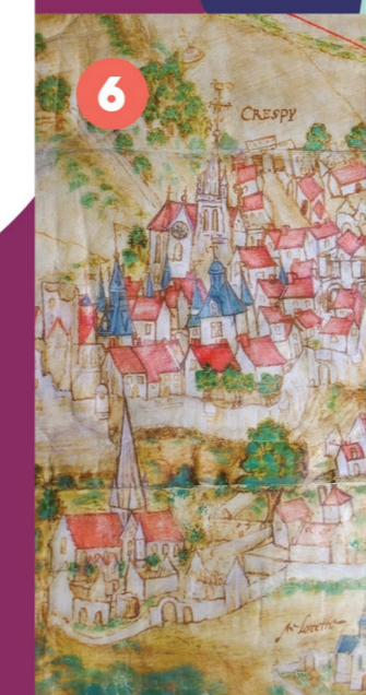
6 SALLE DES FÊTES Conférence