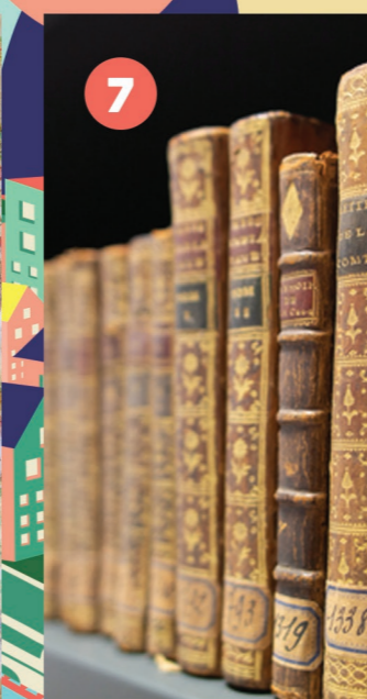
7 HÔTEL DE VILLE Collections patrimoniales