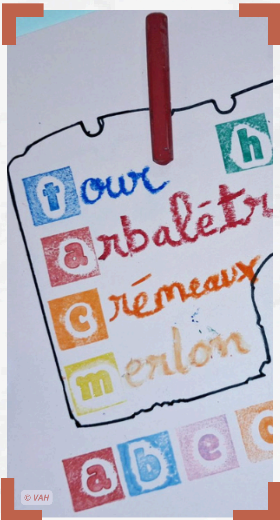
Un abécédaire artistique fortifié